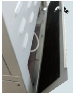
Kit insonorizzazione Kit antiruido Soundproof kit Schalldämmungssatz