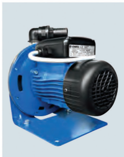
Pompa di rilancio Bomba de relance Booster pump Booster Pumpe