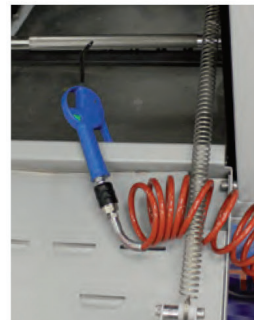
Kit soffiaggio esterno Kit de soplado externo External blowing kit Außen Blase kit