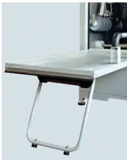
Cavalletto blocca porta Caballete de bloqueo puerta Door lock stand Türhalterung